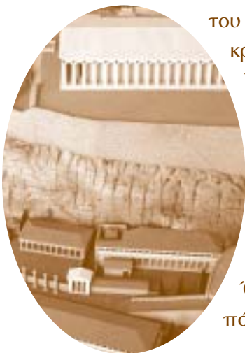
Το Ασκληπιείο έως και τον 2ο αιώνα μ.Χ.

Μ έσα σε λίγα λεπτά ο Μένων είχε σηκωθεί από το κρεβάτι του, είχε φορέσει τον καινούριο χιτώνα που είχε υφάνει γι' αυτόν η μεγαλύτερη αδερφή του, η Αλκινόη –δώρο για τα γενέθλια του– και ύστερα από ένα λιτό πρωινό γεύμα είχε βγει γρήγορα έξω, στην εσωτερική αυλή του σπιτιού, για να συναντήσει τον Φοίνικα. Όμως εκεί τον περίμενε μία δυσάρεστη έκπληξη. Η Φρασίκλεια, η πιο ηλικιωμένη και πιστή υπηρέτρια της οικογένειας, φάνηκε στον επάνω όροφο, όπου βρίσκονταν όλα τα υπνοδωμάτια του σπιτιού. Έβγαινε από το δωμάτιο του Φοίνικα σέρνοντας όσο πιο γρήγορα μπορούσε τα γέρικα πόδια της. Δυστυχώς ο παιδαγωγός του Μένωνα είχε αρρωστήσει την προηγούμενη νύχτα και ήταν αδύνατο να σηκωθεί από το κρεβάτι του, πόσο μάλλον να τον συνοδεύσει στο Ασκληπιείο.