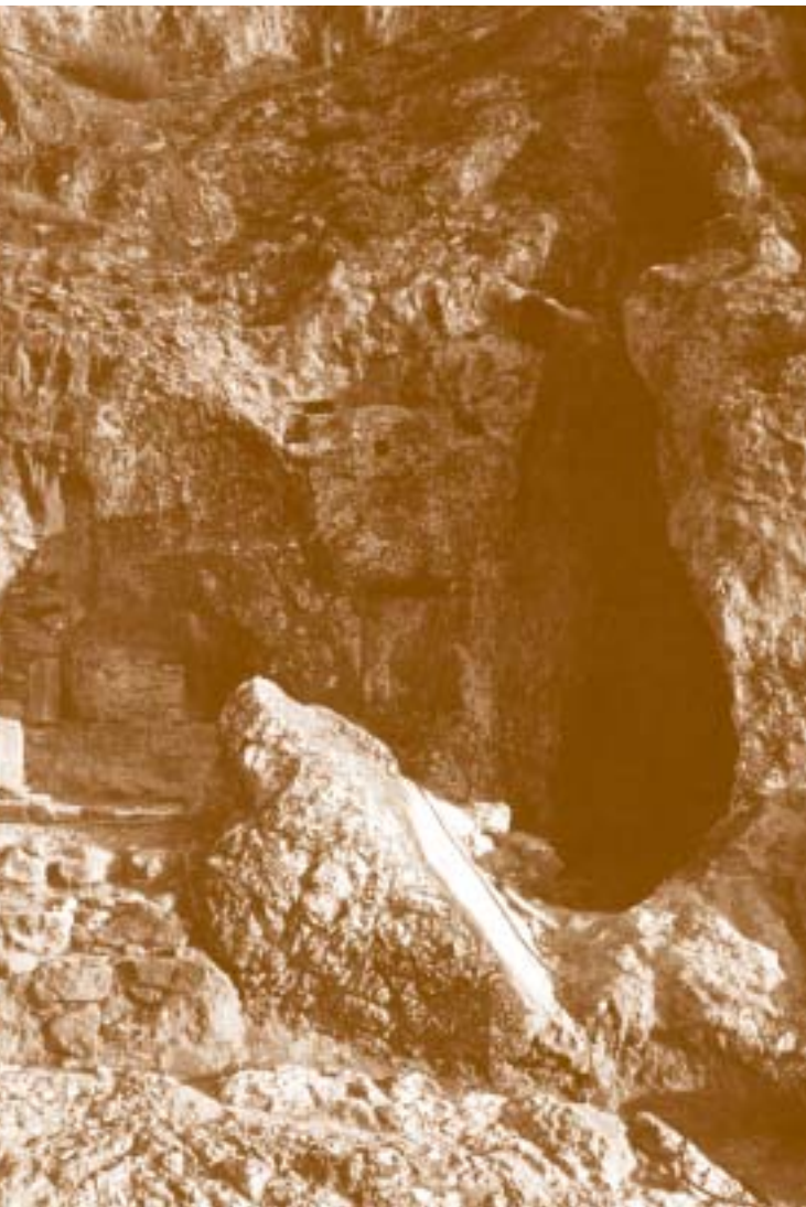
Το Ιερό του Πανός και των Νυμφών

Σ ε λίγο είδε στα δεξιά του δρόμου, μέσα στο βράχο, μία σειρά από σπηλιές. Προχώρησε με διστακτικά βήματα προς την πρώτη σπηλιά και ξαφνικά άκουσε μια φωνή. “Καλωσήρθες στο Ιερό του Απόλλωνα Υποακραίου. Μην ξεχνάς ότι ο θεός Απόλλωνας ήταν ο πατέρας του Ασκληπιού, γι’ αυτό και είναι πρόθυμος να σε βοηθήσει να φθάσεις στον προορισμό σου”.