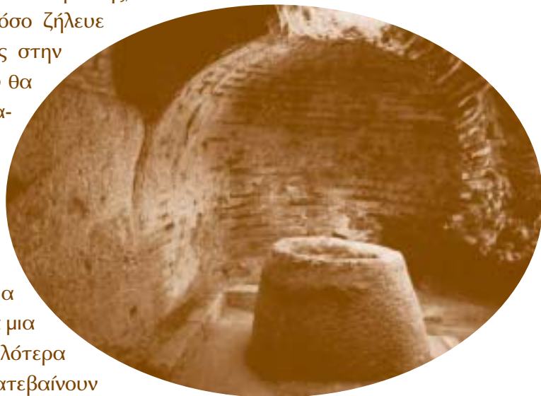
Η Κλεψύδρα σήμερα

Ο Μένων συνέχισε το δρόμο του. Λαχανιασμένος από το γρήγορο περπάτημα και ιδρωμένος από το δυνατό ήλιο έφθασε τελικά ακριβώς κάτω από την Ακρόπολη. Είχε έρθει κι άλλη φορά ως εδώ μαζί με τον Φοίνικα, αλλά είναι αλήθεια πως τώρα όλα του φαίνονταν πιο μεγάλα κι επιβλητικά. Για μια στιγμή κοντοστάθηκε. Ακριβώς απέναντι του, κι αρκετά ψηλότερα από το σημείο στο οποίο βρισκόταν, είδε δύο γυναίκες να κατεβαίνουν κουβαλώντας στους ώμους αγγεία γεμάτα νερό. Προφανώς κάπου εκεί, σκαμμένη στο βράχο θα ήταν η σπηλιά μέσα στην οποία ανέβλυζε το νερό της πηγής, της Κλεψύδρας, σκέφθηκε ο Μένων κοιτάζοντας με απορία γύρω του. Στεκόταν σε ένα σημείο, όπου ο δρόμος διχαζόταν. Δεν ήταν σίγουρος για το ποιο μονοπάτι έπρεπε να διαλέξει. Προτίμησε αυτό που ανοιγόταν προς τα αριστερά του, κυρίως επειδή τον μάγεψε η εικόνα που αντίκριζε προς τη μεριά εκείνη. Δεξιά κι αριστερά του δρόμου υπήρχαν ένα σωρό δέντρα και λουλούδια. Ο αέρας μοσχοβολούσε. Μυρτιές, θυμάρια κι ελιές ήταν λίγα μόνο από τα φυτά που μπορούσε να αναγνωρίσει.