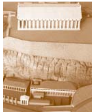
Το Ασκληπιείο έως και τον 2ο αιώνα μ.Χ.