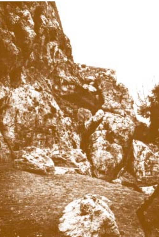
Το Ιερό της Αφροδίτης & του Έρωτα

Κ οιτάζοντας καλύτερα, κατάλαβε ότι ήταν τρεις μικρότερες σπηλιές, η μία δίπλα στην άλλη. Πέρασε διαδοχικά από κάθε μία, χωρίς όμως να συναντήσει κανέναν. Ωστόσο παρατήρησε ότι στα τοιχώματα υπήρχαν μικρά ανοίγματα, σαν σκαμμένες στο βράχο τρύπες, μέσα στις οποίες ήταν τοποθετημένα ειδώλια αφιερωμένα στο θεό Πάνα και τις Νύμφες. Δεν είχε λοιπόν καμία αμφιβολία ότι είχε φθάσει και στο τρίτο Ιερό. Βιαστικός συνέχισε το μονοπάτι που θα τον οδηγούσε στον επόμενο θεό. Ήταν πια σίγουρος πως ο δρόμος αυτός που ακολουθούσε γύρω από την Ακρόπολη, ήταν ο Περίπατος. Του είχε μιλήσει για αυτόν ο Φοίνικας. Του είχε πει πόσο όμορφος ήταν ειδικά σε αυτήν, τη βόρεια πλευρά του. Ωστόσο το τοπίο που έβλεπε γύρω του ξεπερνούσε κάθε φαντασία. Είχε ήδη όμως περπατήσει αρκετά και σκεφτικός, όπως ήταν φοβήθηκε μήπως είχε προσπεράσει κάποια σπηλιά χωρίς να το προσέξει.