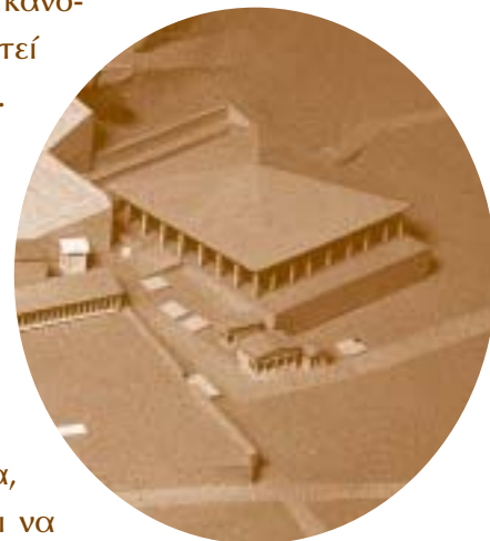
Το Ωδείο του Περικλή

Στο χώρο αυτό, όπως θα έχεις ίσως ακούσει, δίνουν όρκο οι Αθηναίοι έφηβοι ότι θα υπηρετούν πιστά την πατρίδα τους. Εκεί θα ορκιστείς κι εσύ μια μέρα, όταν μεγαλώσεις λίγο ακόμη. Αφήνοντας πίσω σου το Αγλαύρειο, θα πρέπει να προχωρήσεις μέχρι τη νότια πλευρά, ακολουθώντας πάντα τον Περίπατο. Θα δεις στα αριστερά σου πρώτα ένα κλειστό κτήριο με περίεργη στέγη. Αυτό είναι το πρώτο και παλαιότερο ωδείο της πόλης, το Ωδείο του Περικλή, όπου διοργανώνονται μουσικοί αγώνες κατά τη διάρκεια εορτών. Στη συνέχεια ο δρόμος θα σε οδηγήσει στο θέατρο του θεού Διονύσου. Δίπλα του βρίσκεται το Ασκληπιείο”.