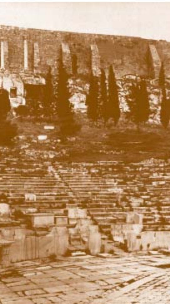
Άποψη του Διονυσιακού Θεάτρου από τα νότια

Ο Μένων πετούσε από τη χαρά του. Η κούραση που είχε αρχίσει να αισθάνεται, έσβησε αμέσως. Στο λεπτό ευχαρίστησε τις ιέρειες της θεάς Αφροδίτης και ξαναπήρε το μονοπάτι, σχεδόν τρέχοντας. Αυτή τη φορά το περπάτημα ήταν περισσότερο από ό,τι υπολόγιζε και ο δρόμος στη ρίζα του Ιερού Βράχου της Ακρόπολης γινόταν πιο απότομος, καθώς έστριβε προς τα ανατολικά. Προχωρώντας λίγο ακόμη είδε στα δεξιά του το μεγάλο σπήλαιο, για το οποίο του μίλησε η ιέρεια. Μία μικρή σκάλα οδηγούσε σε αυτό, ενώ αμέσως στα αριστερά διέκρινε τον περίβολο του μικρού Ιερού, του Αγλαυρείου. Πόσο θα ήθελε να πλησιάσει περισσότερο, να σκαρφαλώσει και να δει τι έκρυβε μέσα της η σπηλιά! Όμως τώρα βιαζόταν. “Υπομονή” σκέφθηκε “σε μερικά χρόνια που θα δώσω κι εγώ εδώ τον όρκο αιώνιας πίστης στην πατρίδα μου, θα μπορέσω να ικανοποιήσω την περιέργειά μου!” και συνέχισε το μονοπάτι προσέχοντας πάντα μην παραπατήσει στο βραχώδες έδαφος. Σε λίγο όμως τα πράγματα άλλαξαν. Η ησυχία και η σχετική απομόνωση που διέκρινε τη βόρεια και την ανατολική πλευρά έδωσαν τη θέση τους στην πολύβουη ατμόσφαιρα της νότιας πλαγιάς της Ακρόπολης. Το τοπίο γινόταν πιο ήρεμο, το έδαφος πιο ομαλό, ακόμα και η βλάστηση φαινόταν εδώ λιγότερο άγρια. Αμέσως ξεχώρισε χαμηλότερα, στα αριστερά του δρόμου το Ωδείο του Περικλή, για το οποίο του είχε μιλήσει η ιέρεια. Εκείνο όμως που τον άφησε κατάπληκτο ήταν το θέατρο του Διονύσου, έτσι όπως το είδε να ανοίγεται μπροστά του.